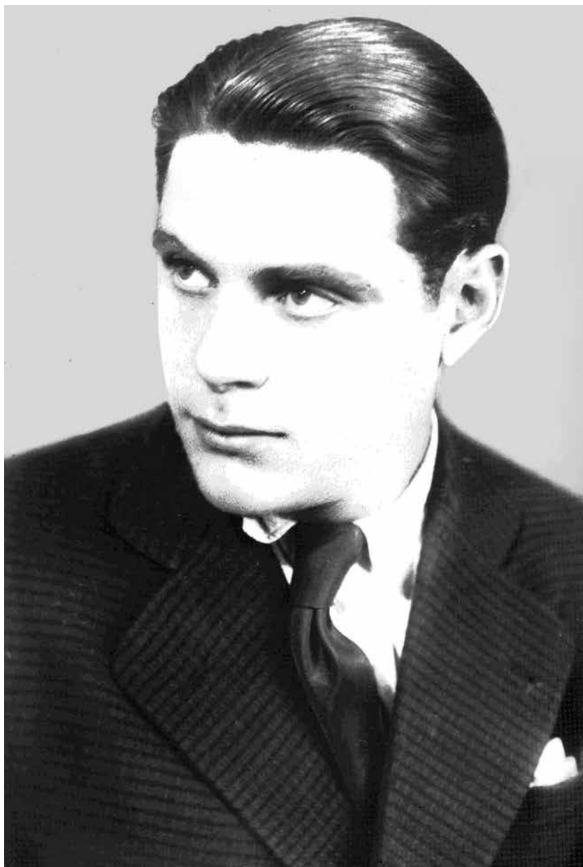
Vladan Desnica (Zadar, 17. rujna 1905. – Zagreb, 4. ožujka 1967.)